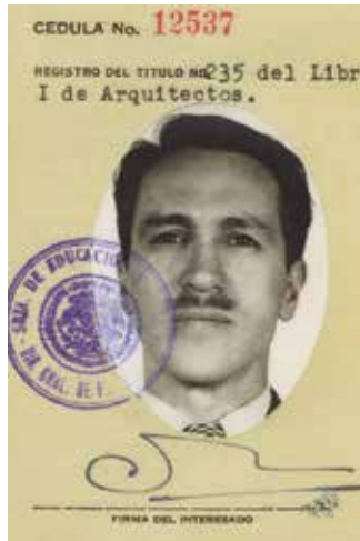
«Credenciales del arquitecto Carlos Leduc, de arriba hacia abajo: Escuela Nacional Preparatoria, 1926; Universidad Nacional Autónoma de México, 1934; Cédula Profesional, 1949. Cortesía: Archivo Paul Leduc Rosenzweig.»

Las miradas que Carlos Leduc construyó, son producto de la carga política y cultural de su época; éstas aportaron una visión sobre la arquitectura moderna que derivó en estudios antropométricos y climatológicos producto de una conciencia clara sobre el lugar. El resultado se materializó en un lenguaje tipológico y geométrico propio. Esto será una constante en sus proyectos de educación, salud y vivienda, dando como resultado apuestas espaciales que definieron programas apropiados y apropiables. Las nuevas propuestas empleadas en la elaboración del proyecto arquitectónico parten de una sensibilidad única cuyo fin es la transformación de la realidad.