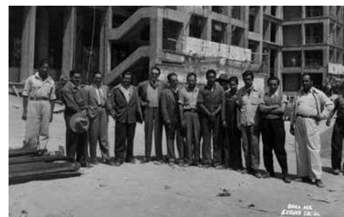
Obras del Seguro Social, 3 de marzo de 1949.