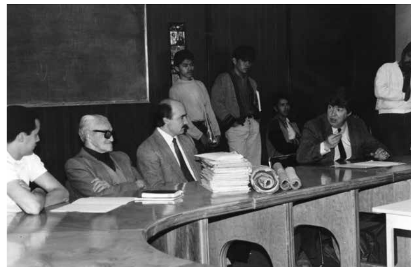
Acto de recepción del archivo de Carlos Leduc Montaña a la UAM Azcapotzalco.

En México, particularmente, el abandono del proyecto de nación posrevolucionario se manifestó en la década de los 80. La reducción del Estado a un ente que debe limitarse únicamente a administrar y garantizar seguridad fue la premisa que, a partir de ese momento, regiría las decisiones gubernamentales. El tiempo en el que el Estado habría de invertir en la construcción de escuelas, viviendas y hospitales han quedado atrás. Hoy, la iniciativa privada es quien rige las dinámicas de producción arquitectónica.